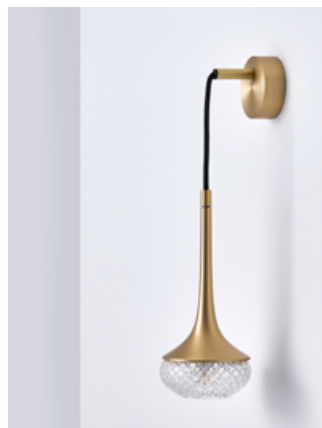
Applique – Wall light Fléa SB