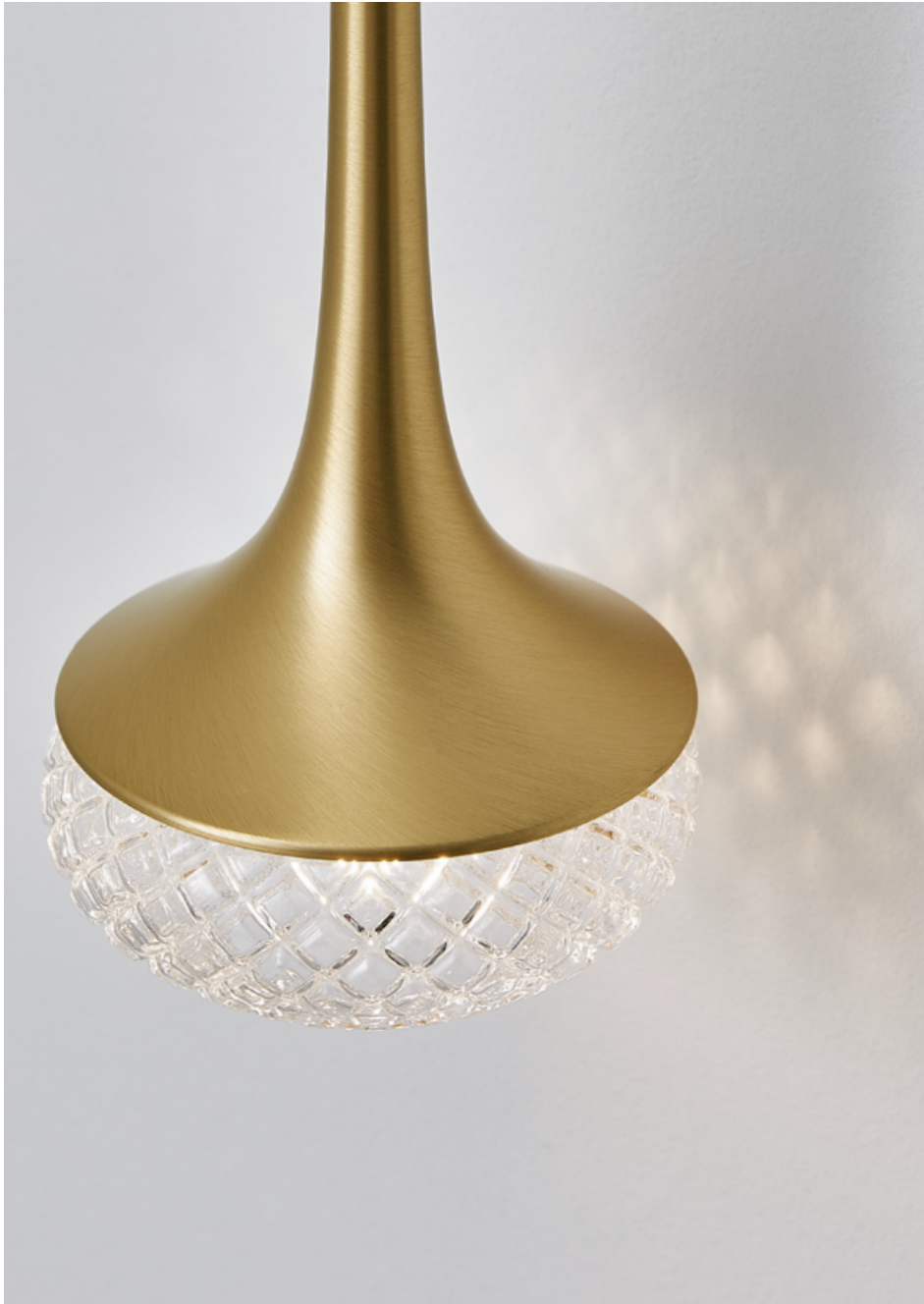
Applique – Wall light Fléa SB