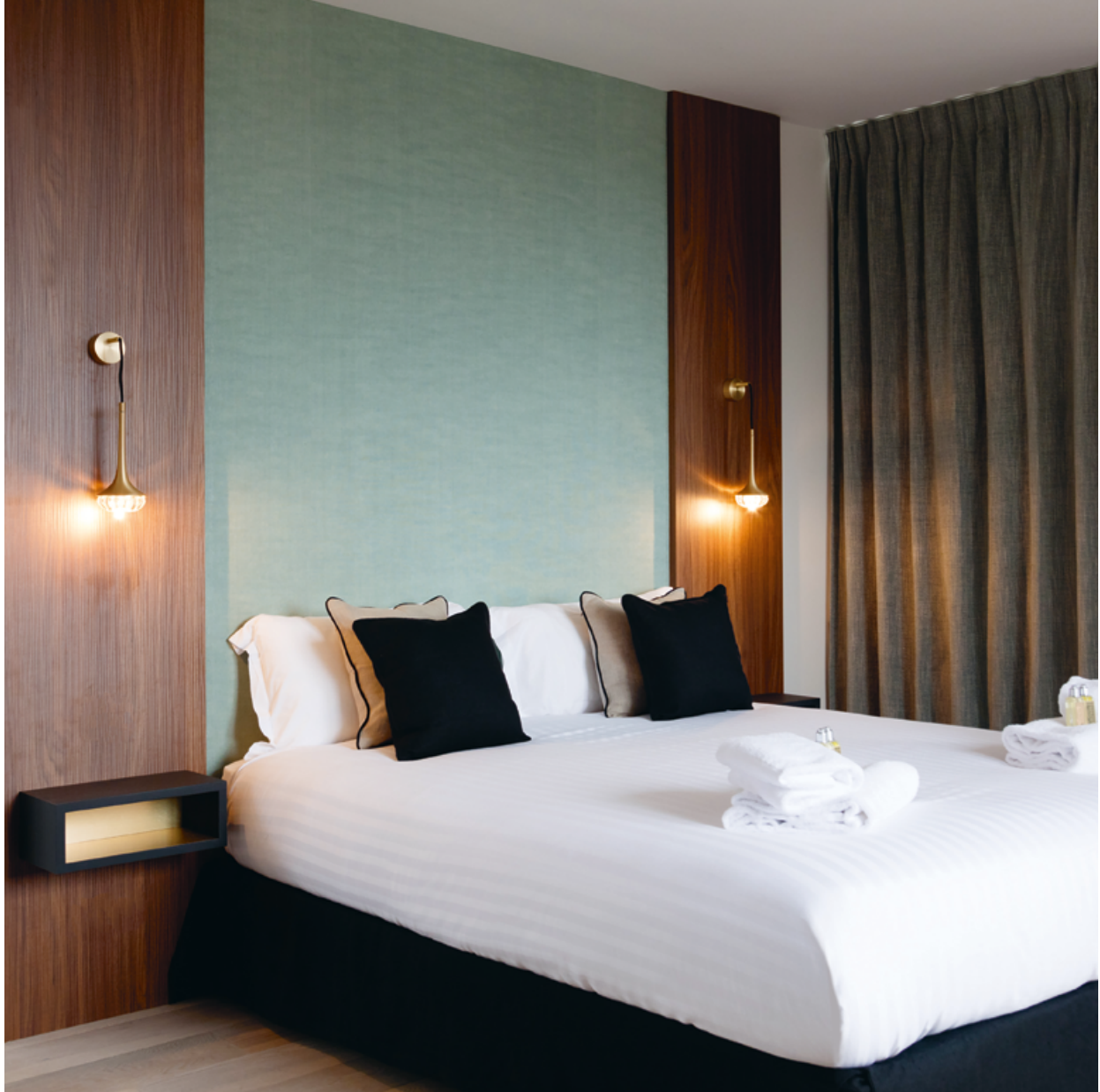
Applique – Wall light Fléa SB