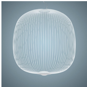
Spokes 2 Large