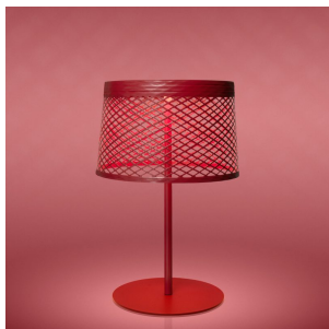
Twiggy Grid XL