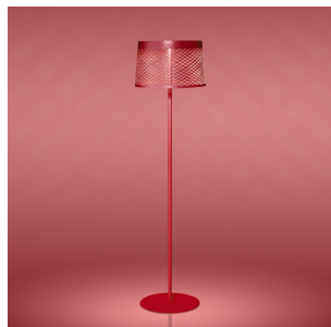
Twiggy Grid Lettura