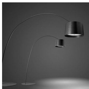
Twice as Twiggy