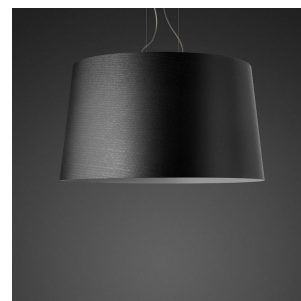
Twice as Twiggy