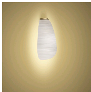
Rituals 1 Mix&Match