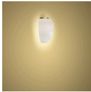
Rituals 3 Parete