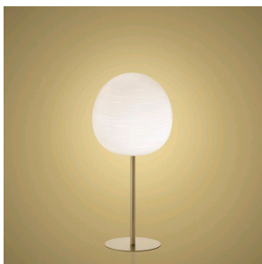
Rituals XL Mix&Match