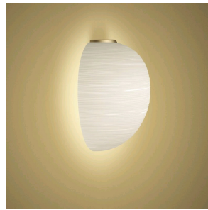
Rituals XL Mix&Match