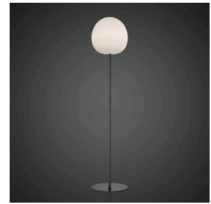
Rituals XL Mix&Match