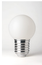
BASI-FP1401 ALUMINIUM POLI POLISHED ALUMINIUM