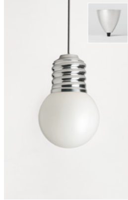
BASI-FP2201 ALUMINIUM POLI POLISHED ALUMINIUM