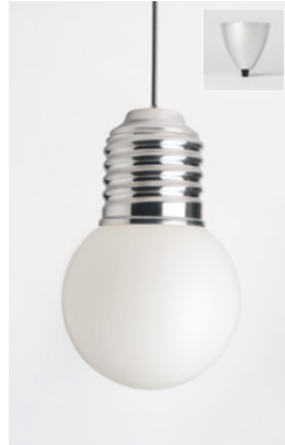
BASI-FP1201 ALUMINIUM POLI POLISHED ALUMINIUM