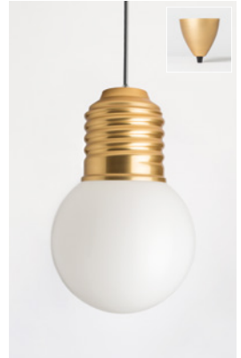
BASI-FP12C2 OR GOLD