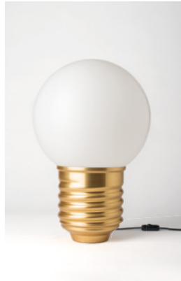
BASI-FP11C2 OR GOLD