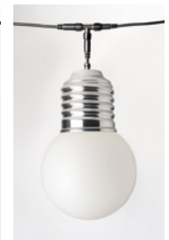
BASI-FP1701 : GUIRLANDE 5 LAMPES 5 LAMPS GARLAND ALUMINIUM POLI POLISHED ALUMINIUM