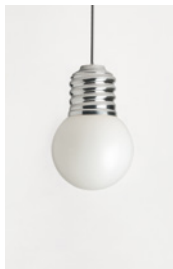
BASI-FP2501 ALUMINIUM POLI POLISHED ALUMINIUM