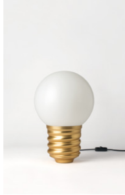
BASI-FP21C2 OR GOLD