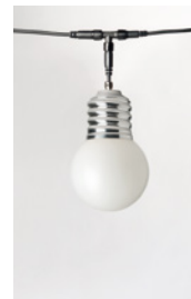
BASI-FP2701 : GUIRLANDE 5 LAMPES 5 LAMPS GARLAND ALUMINIUM POLI POLISHED ALUMINIUM