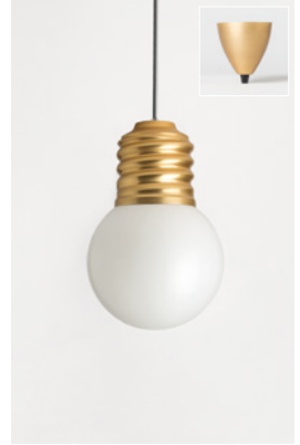
BASI-FP22C2 OR GOLD