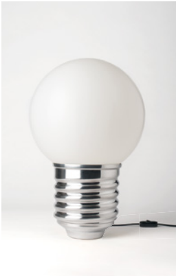
BASI-FP1101 ALUMINIUM POLI POLISHED ALUMINIUM