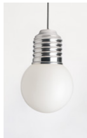
BASI-FP1501 ALUMINIUM POLI POLISHED ALUMINIUM