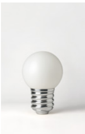
BASI-FP2401 ALUMINIUM POLI POLISHED ALUMINIUM