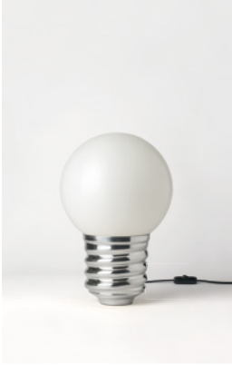
BASI-FP2101 ALUMINIUM POLI POLISHED ALUMINIUM