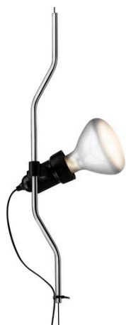
F5700058 Parentesi dimmer élément de complément - Nickel