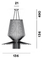
SCHÉMA ET ÉMISSION DE LUMIÈRE