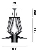
SCHÉMA ET ÉMISSION DE LUMIÈRE